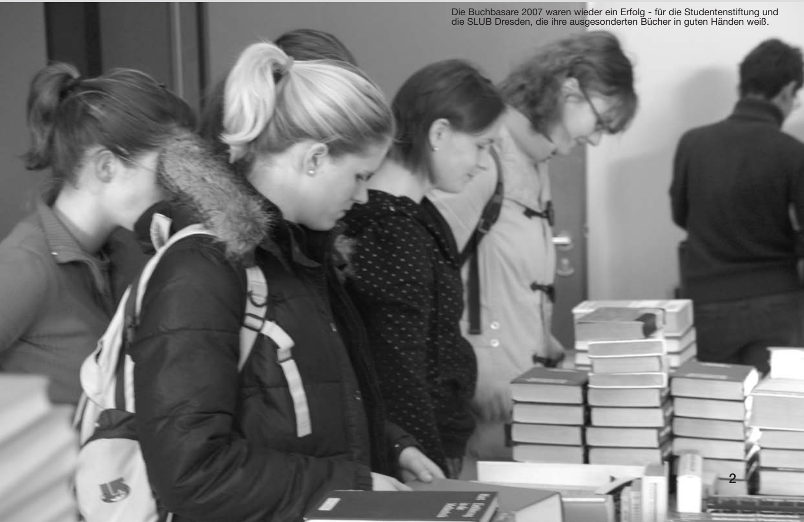
Die Buchbasare 2007 waren wieder ein Erfolg - für die Studentenstiftung und die SLUB Dresden, die ihre ausgesonderten Bücher in guten Händen weiß.

Editorial 3 | Aktion Leerstuhl 4 | Projekte 2007 5 | 50. SLUB-Sonntag 6 Stiftungsaufbau; Finanzbericht 2007 7 | Partner 8